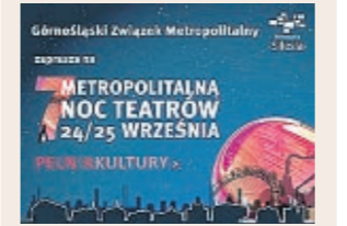
Metropolitalna Noc Teatrów 24/25 września

Podczas 7.MNT widzowie mają do dyspozycji bezpłatny transport. 10 oznakowanych autobusów będzie kursować między wybranymi teatrami. Aby skorzystać z bezpłatnego przejazdu, trzeba mieć wypełniony bilet. Jeden uprawnia do przejazdu jednej osoby i wany jest powypelnieniu. Należy go wrzucić do urny w autobusie, obok kierowcy. Bilety dostępne są w teatrach biorących udział w 7.MNT (ulotki), a kierowców w wersji elektronicznej na: www.pelniakultury.pl. ●