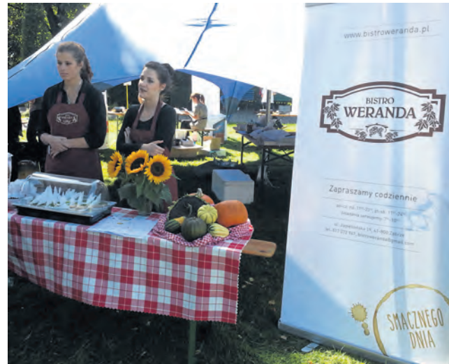
► „Piknik w rytmie firmy” był spotkaniem producentów i konsumentów. Jedni pokazali ofertę, a drudzy ją smakowali. Z korzyścią dla wszystkich...

„Zabrzeński biznesplan” to konkurs, którego zakończenie odbędzie się na przełomie roku podczas uroczystego otwarcia nowej siedziby Zabrzeńskie Centrum Rozwoju Przedsiębiorczości. To konkurs, który ma na celu pobudzenie aktywności mieszkańców zmierzającej do zakładania i prowadzenia własnej działalności gospodarczej. Ogłoszony został we wrześniu tego roku, a mogli brać w nim udział wszyscy planujący założyć działalność gospodarczą, jak też mikroprzedsiębiorcy. Na początku były szkolenia m.in. właśnie dotyczące zasad pisania biznesplanu i reguł rządzących biznesem. Dopiero później, na przełomie