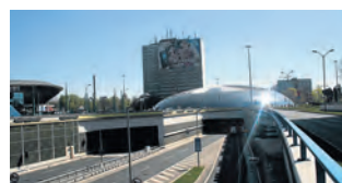
► Katowice, dzięki inwestycjom, notują też ożywienie gospodarcze

Rynku oraz ulicy Piotra Skargi. Do końca 2014 roku zakończona zostanie przebudowa ulic 3 Maja, Młyńskiej i Pocztowej. Należy pamiętać o projekcie budowy i modernizacji kanalizacji, a także wymiany torowisk i zakupu nowych tramwajów. Ale miasto, mimo zaangażowania w śródmieściu, nie zmniejsza nakładów na modernizację dzielnic. Przykłady? To chociażby gruntowna modernizacja Pałacu Młodzieży i budowa